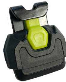
28mm-sleeve mit Schnalle